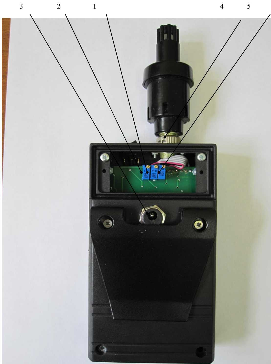
Рис.2. Вид газоанализатора СИГНАЛ -4КМ сзади со снятой крышкой.