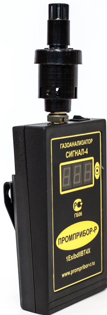
Рис.3. Внешний вид газоанализатора СИГНАЛ-4КМ